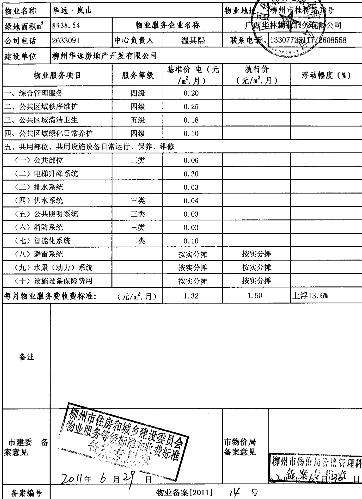
柳州市物业服务等级标准和收费标准备案表